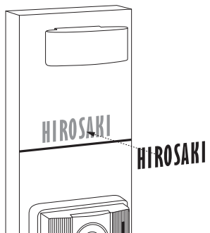
ネームシールサンプル(原寸大)